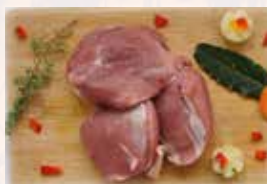
22026 - 2 x 1 kg Sauté de dinde Cuisse désossée avec peau sans os