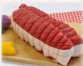
11022 - 2 x 1 kg Rosbif Cœur de rumsteck épluché Pièce de 1 kg environ