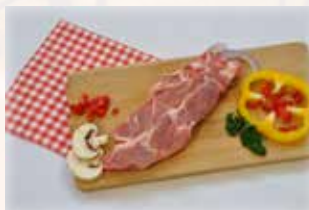
14105 - 2 x 1 kg Côte de porc /échine Sachet de 1 kg environ