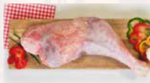
22028 - 2 x 1 kg Cuisse de dinde avec os 2 pièces de 800g à 1,5 kg