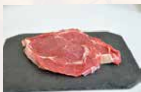
11211 - 2 x 1 kg Entrecôte Pièce de 230g environ