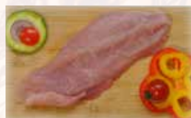
22023 - 2 x 1 kg Escalope de dinde Découpe normale Pièce de 110g environ