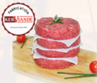
11300 - 2 x 1 kg steak haché bœuf surgelé ❄️ Provenant de morceaux dénervés dégraissés 130g/pièce - sachet de 2 kg